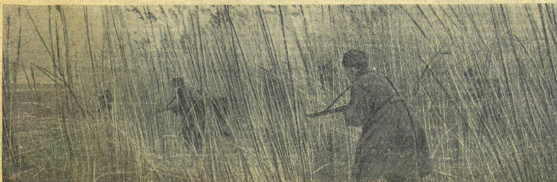
НА КУБАНИ. Автоматчики продвигаются на новый рубеж.

В ходе одного из налетов два наших истребителя встретились с двумя «Фокке-Вульф-190» и нанесли им бой. Немцы не выдержали атаки советских летчиков и скрылись, оставив без охраны с воздуха железнодорожную станцию. Наши штурмовики, сопровождаемые истребителями, беспрепятственно атаковали воинский эшелон немцев, причем разбили несколько вагонов и продовольственный склад.