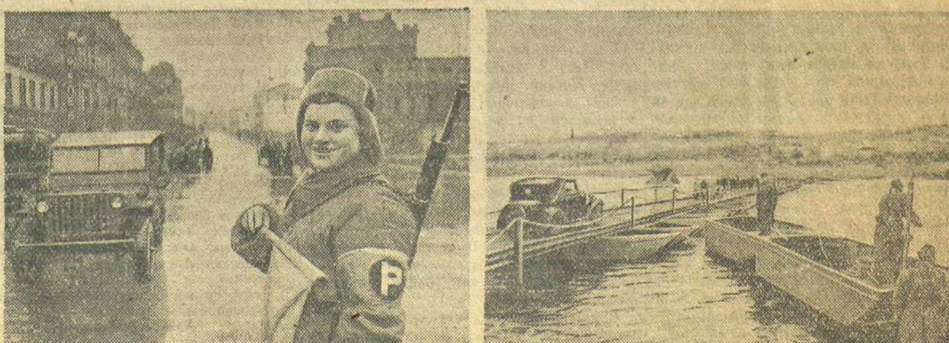
СЕГОДНЯ В КИЕВЕ. На снимках: 1. На улице Крещатик. 2. На мосту, введенном нашими понтонерами через Днепр. Снимки нашего спец. фотокоор. капитана А. Капустанского.